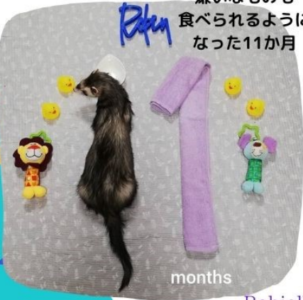
嫌いなものも 食べられるように なった11か月