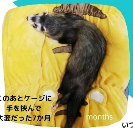
このあとケージに 手を挟んで 大変だった7か月

名前：ロビン 性別：男の子 誕生日：2019.04.18 体重：1350~1400g ファーム：マーシャル 特徴：顔と手が大きい、尻尾長め