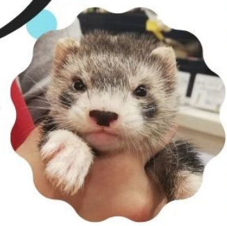
初めての出会いのときに撮った 一番大切な写真