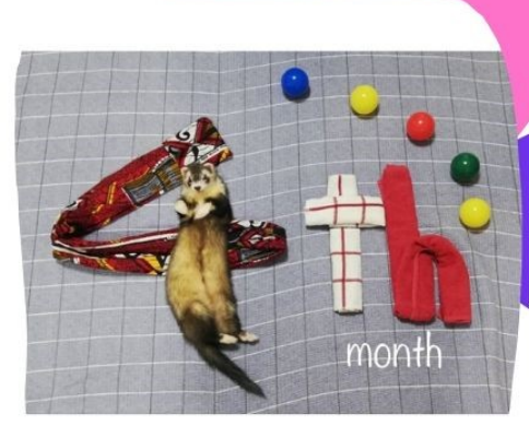
奇跡の一枚が撮れて大はしゃぎした4か月