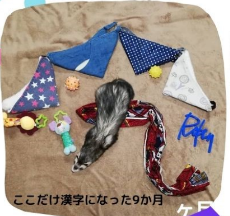
ここだけ漢字になった9か月