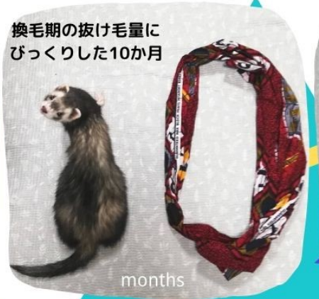
換毛期の抜け毛量に びっくりした10か月