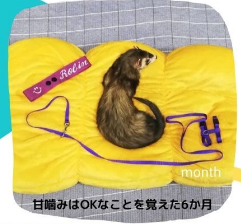
甘噛みはOKなことを覚えた6か月