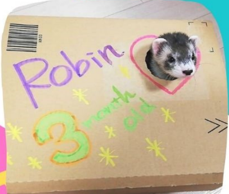
新しい家にも慣れてきて いたずらっ子な3か月