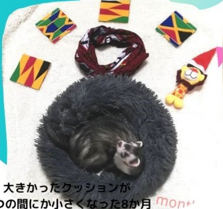
大きかったクッションが いつの間にか小さくなった8か月